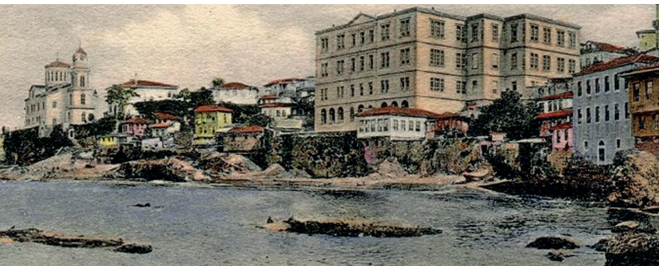
Άποψη τῆς Τραπεζούντας. Διακρίνεται δεξιὰ τὸ Φροντιστήριον καὶ ἀριστερὰ ὁ Μητροπολιτικὸς Ναὸς τοῦ Ἁγίου Γρηγορίου Νύσσης.