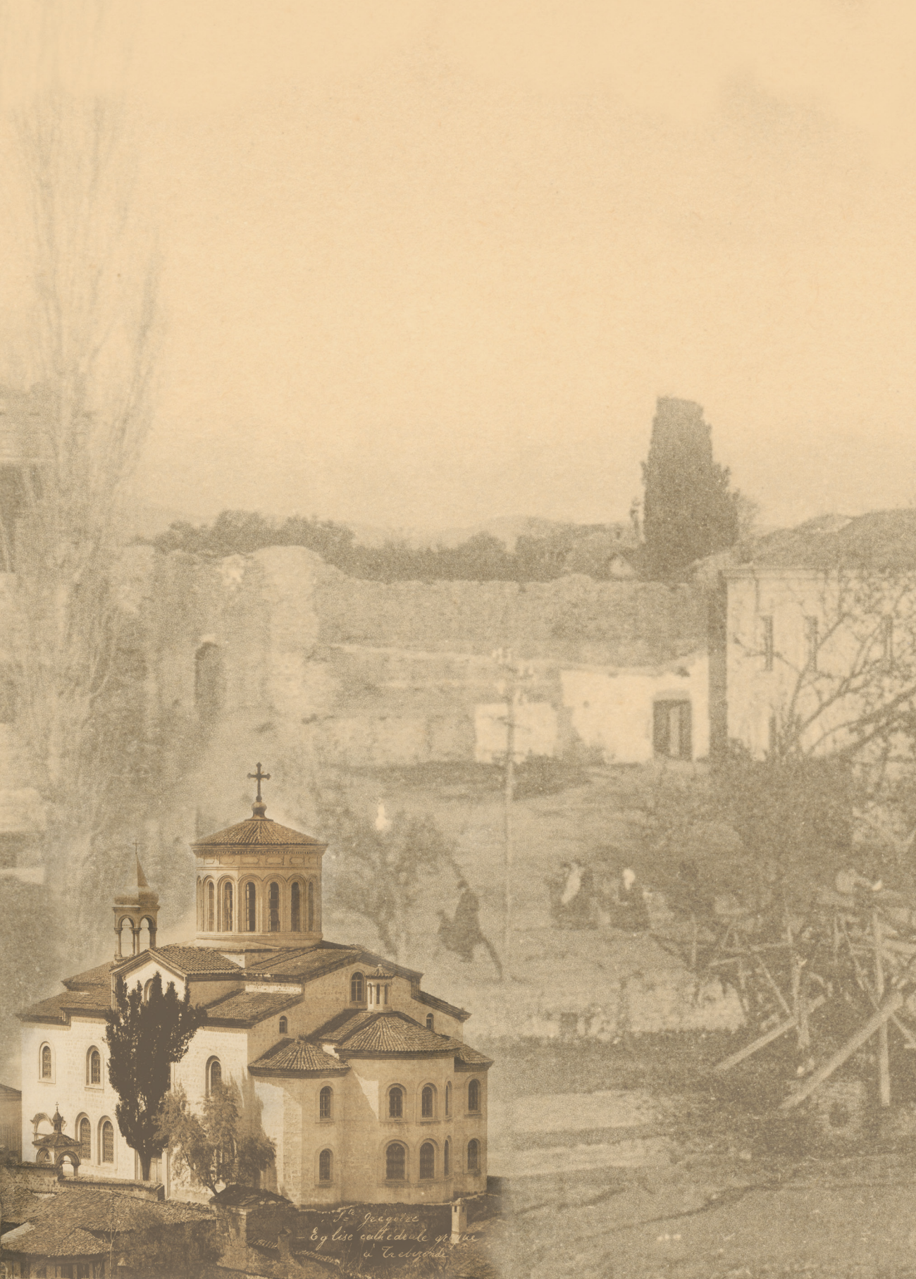
L'Esglise - Eglise cathédrale de à Toulon