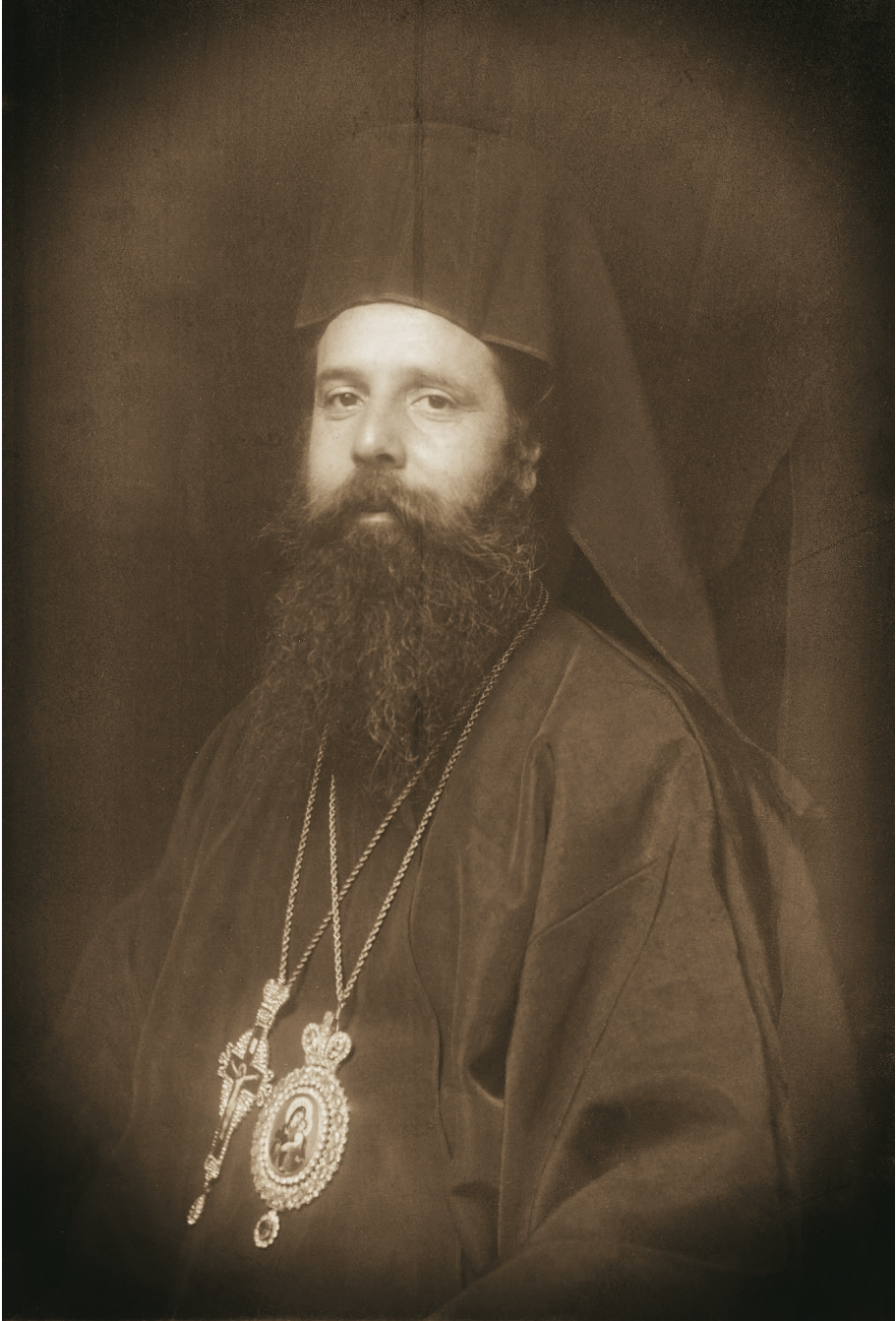
Ὁ Μητροπολίτης Τραπεζοῦντος Χρῦσανθος Φιλιππίδης.