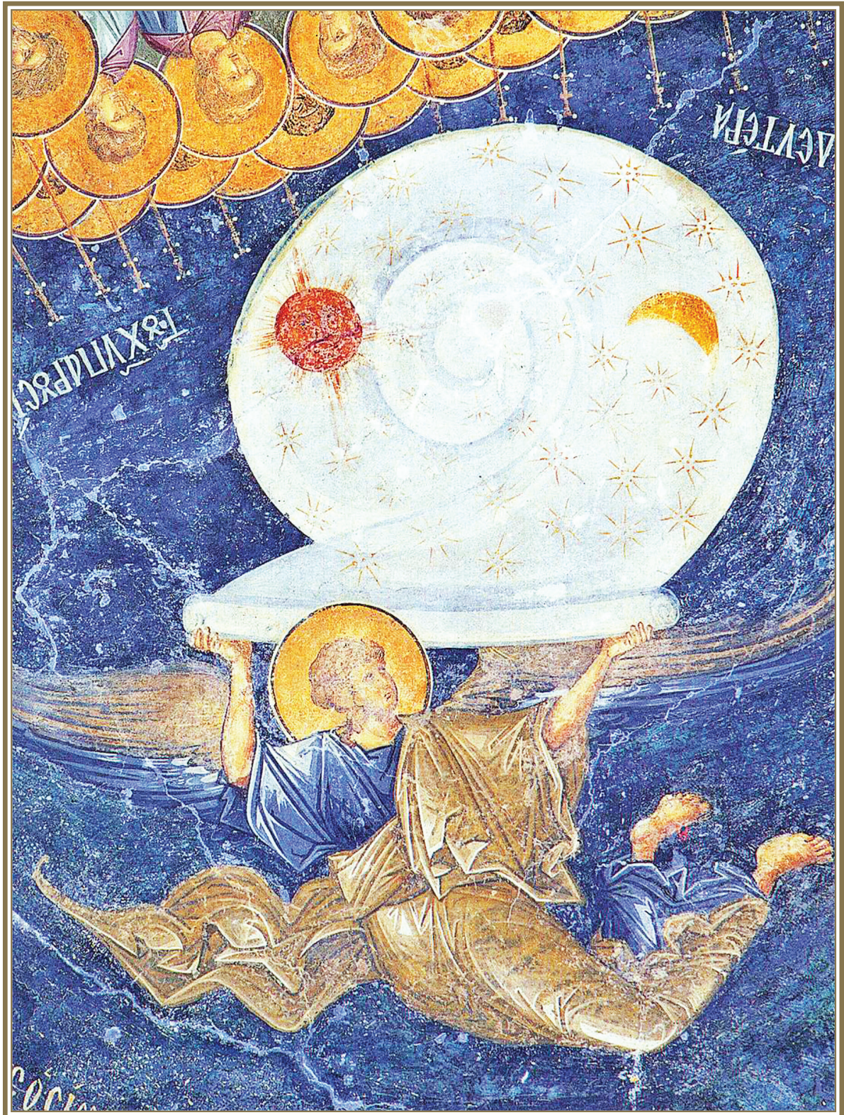
Φωτ. 3. Συμβολική εικόνα του σύμπαντος ως έλικοειδές κέλυφος 13 ου μ.Χ. αιώνας. Καθολικό τής Μονής τής Χώρας τών Ζώντων πλησίον τής Πύλης τής Αδριανούπολης στήν Κωνσταντινούπολη.