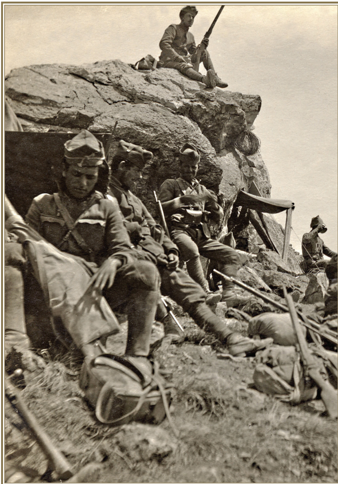
Φωτ. 5. Έλληνες στρατιώτες σε κάποια φάση τῶν μαχῶν στὸν Σαγγάριο, Αὐγούστος 1921