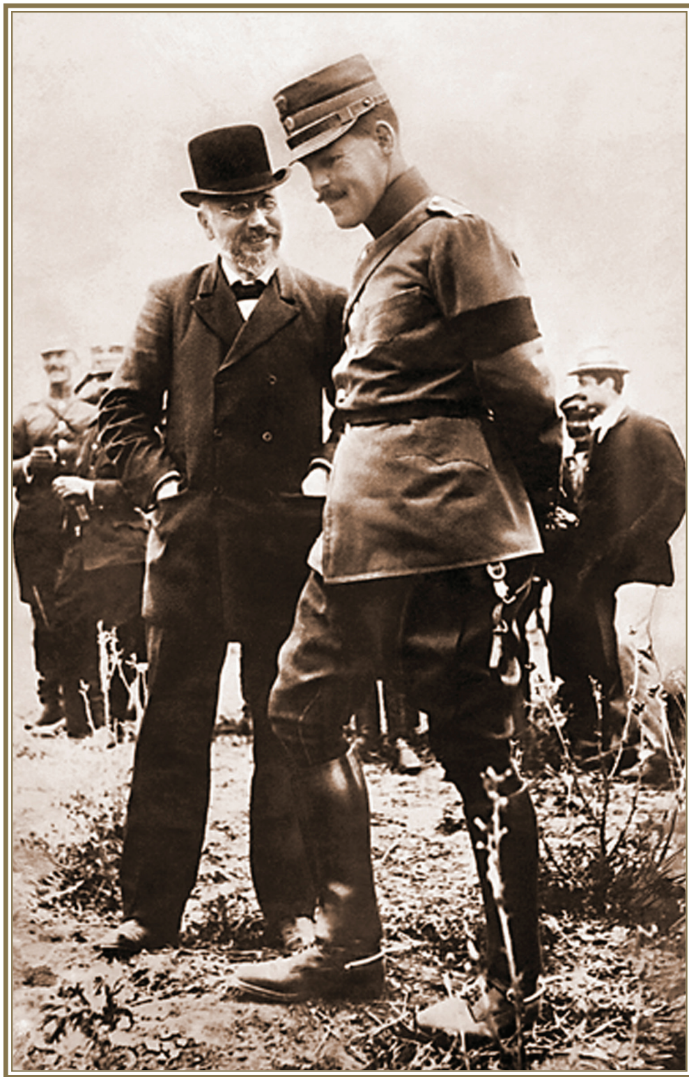
Φωτ. 1. Ο Έλευθέριος Βενιζέλος και ο Βασιλιάς Κωνσταντίνος ο Α' τό 1912 πριν τον διχασμό, όταν τό έθνος ένωμένο μεγαλουργοΰσε άπελευθερώνοντας τή Μακεδονία και τό Αιγαίο.