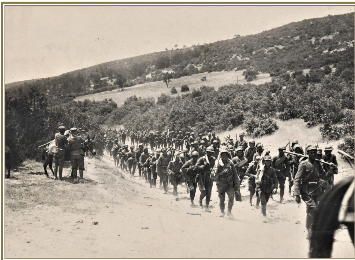
Φωτ. 2. Έλληνικά τμήματα σε πορεία κατά τή μάχη του Έσκι Σεχέρ, 1921