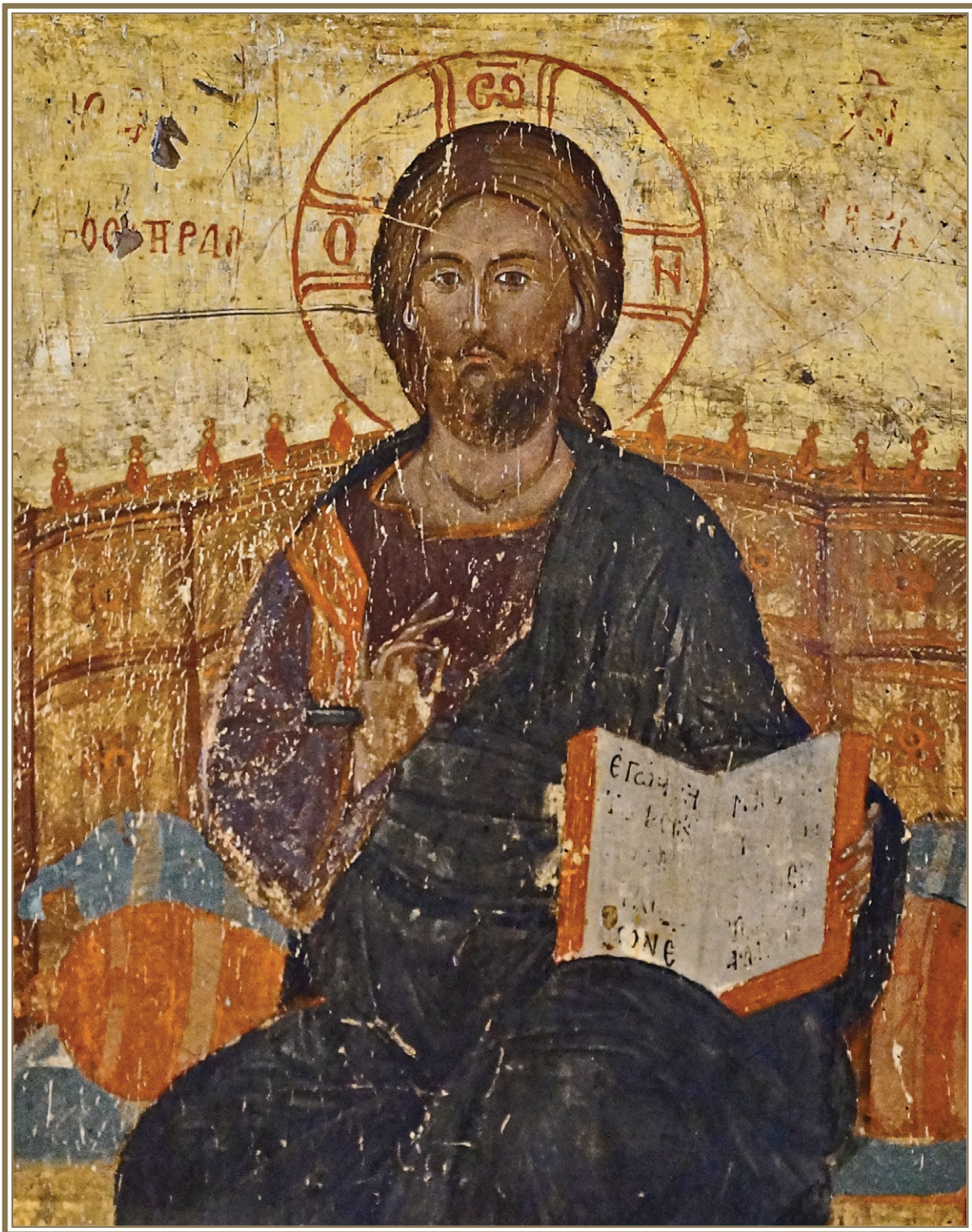
Φωτ. 4. Χριστός ἔνθρονος Παντοκράτωρ, Ἐκκλησιαστικό Μουσεῖο Κομοτηνῆς (16 ος αἰ.)