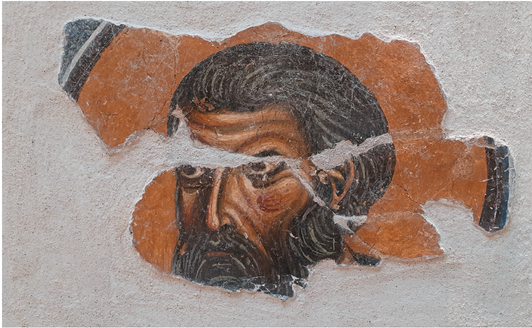
Είκ. 8. Διδυμότειχο. Βυζαντινὸ Μουσείο. Σπάραγμα εὐαγγελιστοῦ Μάρκου (BA σφαιρικό τρίγωνο τρούλου Μονῆς Ληνοῦ).