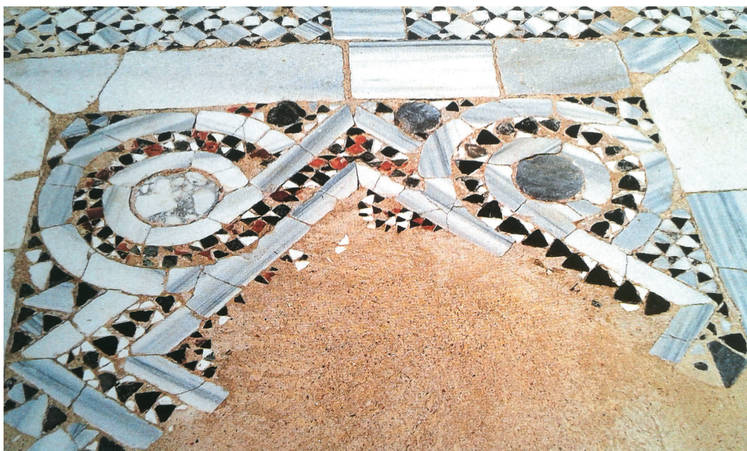
Είκ. 5. Παπίκιον ὄρος, καθολικὸ Μονῆς Ληνοῦ. Πεντάμορφον κυρίως ναοῦ.