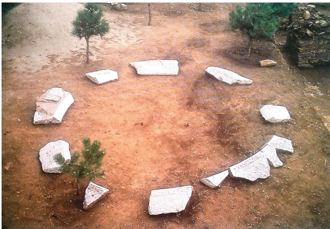
Είκ. 4. Παπίκιον ὄρος, καθολικὸ Μονῆς Ληνοῦ. Ἡ μαρμάρινη κορωνίδα τοῦ τρούλλου.