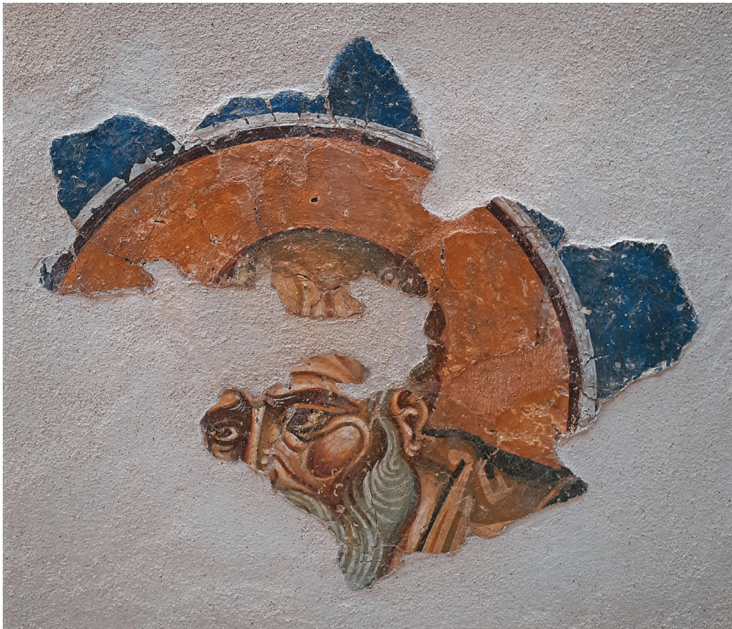
Είκ. 9. Διδυμότειχο. Βυζαντινὸ Μουσείο. Σπάραγμα ἁγίου Ἰωάννου Θεολόγου (NA σφαιρικό τρίγωνο τρούλου Μονῆς Ληνοῦ).